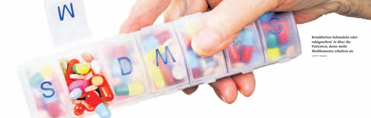
Krankheiten behandeln oder ruhigstellen? Je älter die Patienten, desto mehr Medikamente erhalten sie